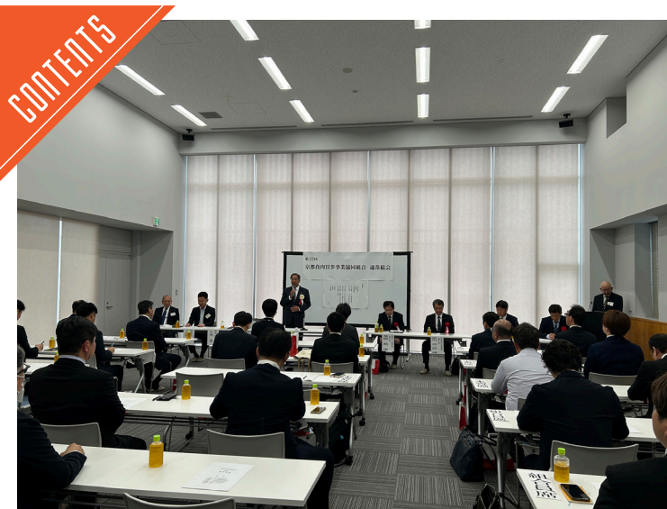
京都食肉買参事業協同組合は、第57回通常総会を開催した……P7

九州支局 ☎812-0029 福岡市博多区古門戸町3-12 TEL092-271-7816 FAX092-291-2995