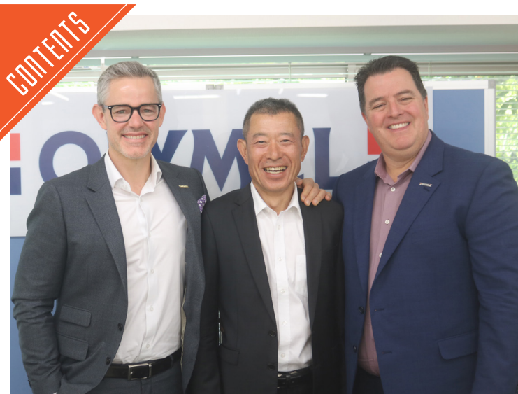
オリメル社のジャーベイスCEO、リベストCOO(次期CEO)が来日……P2~3

九州支局 〒812-0029 福岡市博多区古門戸町3-12 TEL092-271-7816 FAX092-291-2995