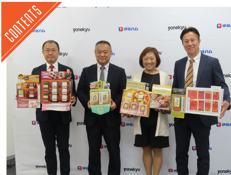
伊藤ハム米久HDは、西宮工場で2026年夏ギフト発表会を開催した……P3

九州支局 〒812-0029 福岡市博多区古門戸町3-12 TEL092-271-7816 FAX092-291-2995